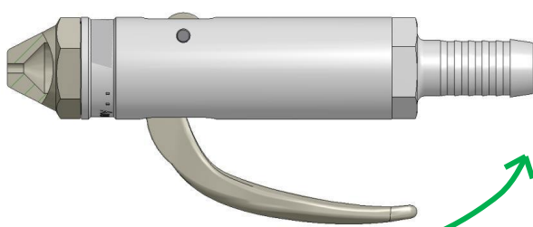
geschlossen (kein Durchfluss)